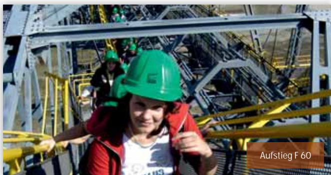
Aufstieg F 60

Das Andenken an imposante Zeugen der Industriekultur, die über Jahrhunderte Broterwerb und Alltagsleben der Menschen bestimmten, wird in der gesamten Lausitz, in Brandenburg und Sachsen, bewahrt und ist vielerorts wieder erlebbar. Bedeutende Industriezweige prägen seit Jahrhunderten unsere Region. Dazu zählen neben dem Braunkohletagebau und der Energiegewinnung vor allem die Textil- und Glasindustrie und der Maschinenbau.